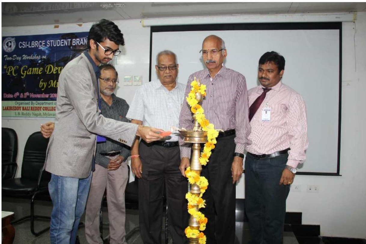
Inauguration of Two day workshop on “PC GAME DEVELOPMENT”