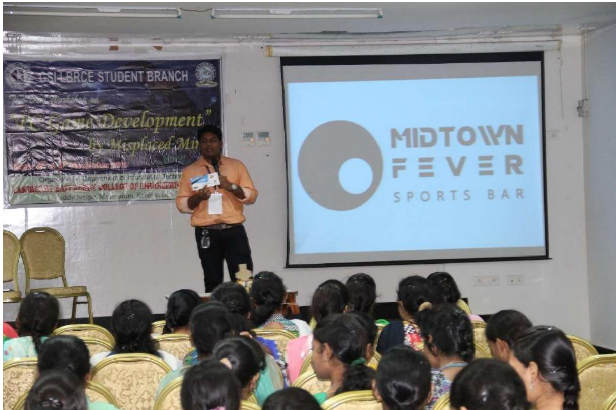
@ participants in the "PC GAME DEVELOPMENT" workshop @